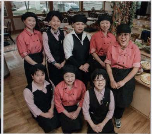
(左・中)畑に観光客を案内して食や農業の魅力を伝える「畑ガイド」。北海道帯広市の女性農家が起業したサービスだ (右)主婦たちが立ち上げた農家レストラン「バーバースダイニング」(岐阜県中津川市)。地元食材を使った家庭料理が大人気に

秋田やまもとの「JAンビニ(ジャンビニ)ann・an」は、店舗運営スタッフの全員が組合の女性部員だ。おにぎりや弁当、惣菜はすべて、地元食材を使って店内で調理したもので、高齢者への宅配事業も行っている。